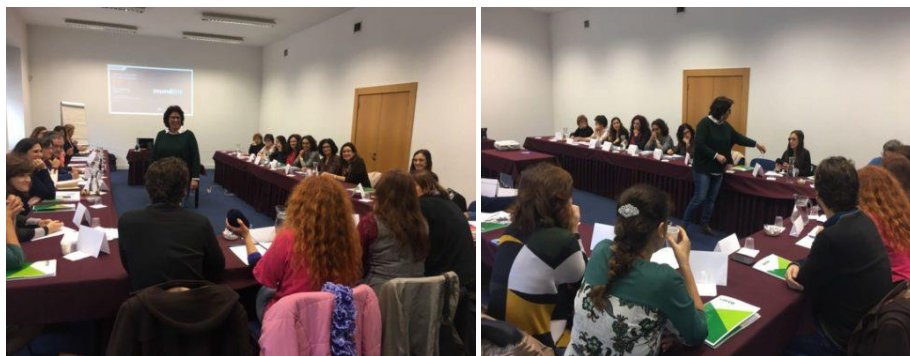
Ação de formação em Lisboa – Fundação Cidade Lisboa - 25 novembro 2017

A DECO estabeleceu uma parceria com a ASPEA – Associação Portuguesa da Educação Ambiental, para a conceção dos conteúdos informativos, da apresentação powerpoint e realização de 6 ações de formação sobre educação ambiental e do consumidor, especialmente dirigidas para os professores do 2.º e 3.º ciclo, nas cidades de Évora, Coimbra, Viana do Castelo, Lisboa, Faro e Porto.