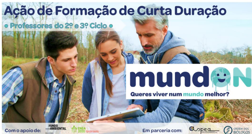
Cartaz de divulgação da ação de formação para professores em www.decoforma.pt

Nestas ações de formação, os formadores da ASPEA capacitaram os professores participantes sobre a temática do consumo sustentável e procuraram incentivar estes importantes agentes de educação ambiental para a transmissão de boas práticas de consumo sustentável junto dos seus alunos.