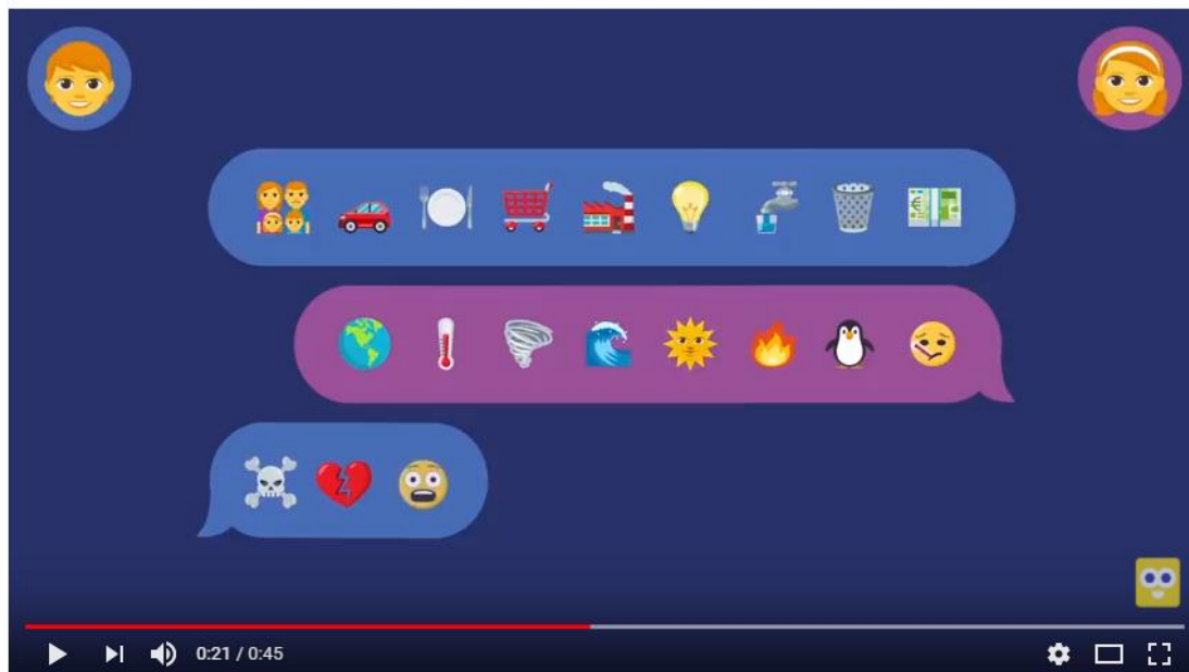
Vídeo do projeto Mundo ON – Queres viver num mundo melhor ? (versão final)

sustentabilidade e inclui igualmente os banners produzidos para cada uma das áreas (energia, água, compras, mobilidade, resíduos e compras).